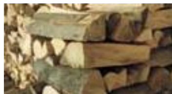
ノバトロニック薪焚きボイラ