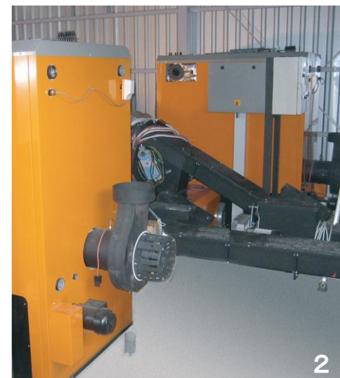
1. ペレット用サイロ 2. 2基のペレットボイラ