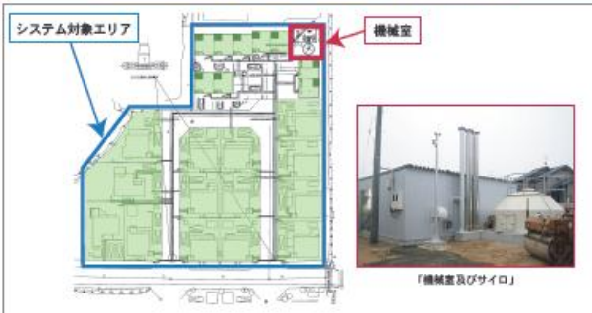
安岡エコタウン・システムレイアウト図